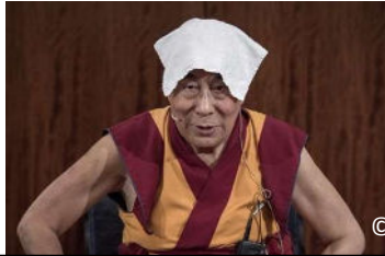
© delormenutrition – Programme SOINS du SII